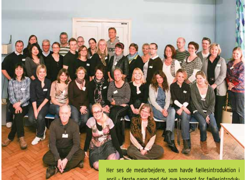
Her ses de medarbejdere, som havde fællesintroduktion i april - første gang med det nye koncept for fællesintroduktionen.

"Med den nye fællesintroduktion ønsker vi at sætte en ny standard for introduktion af nye medarbejdere til et hospital. Introduktionen skal