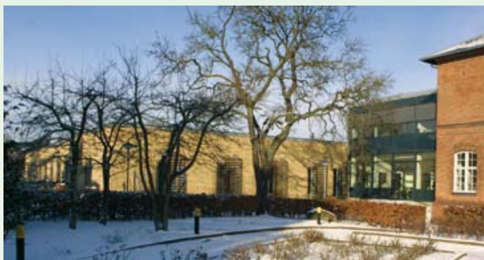
Psykiatrien er fra årsskiftet organisatorisk flyttet fra Frederiksberg Hospital til Psykiatrivirksomheden i Region Hovedstaden.